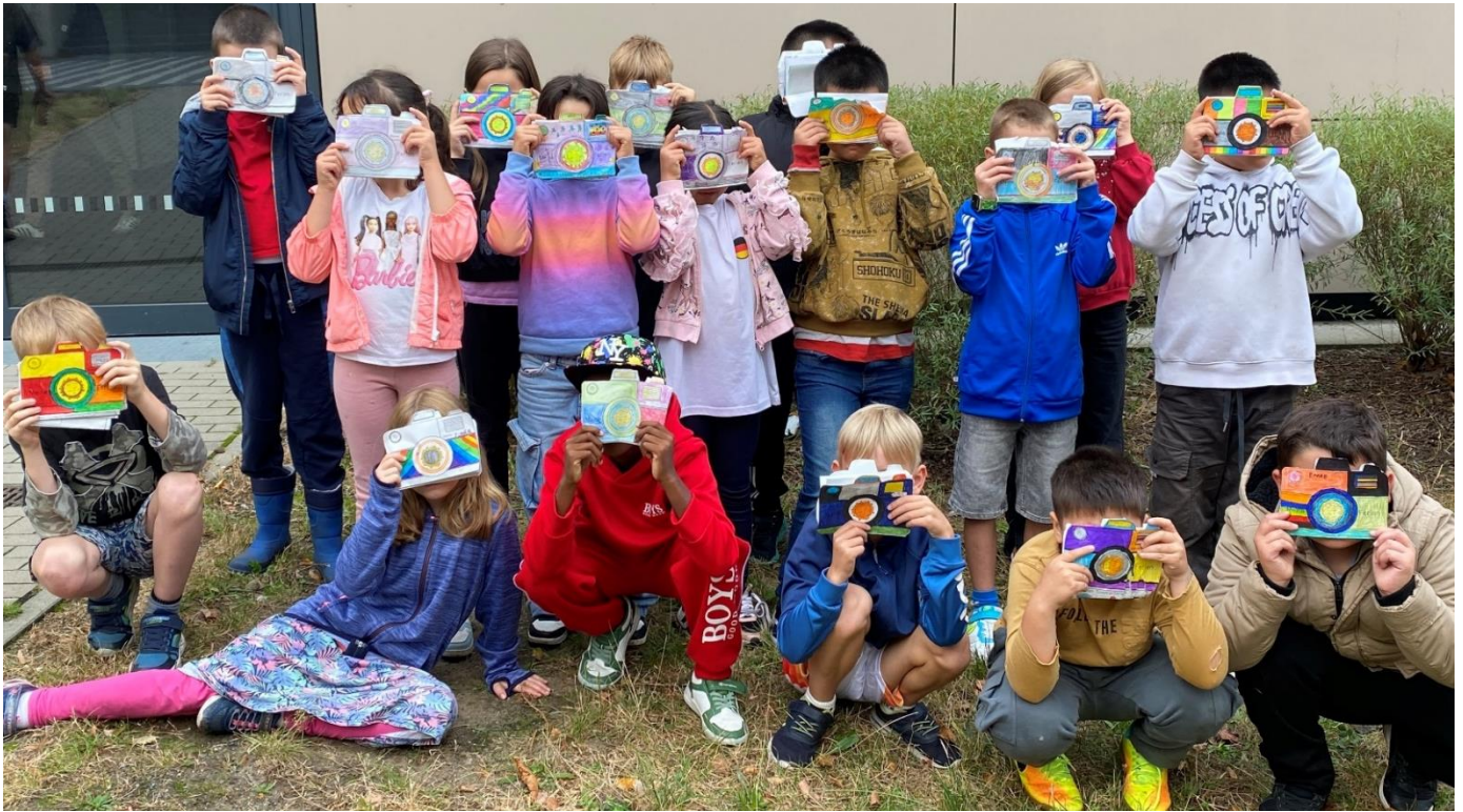
Klick, klick - Neues Schuljahr, neues Glück!